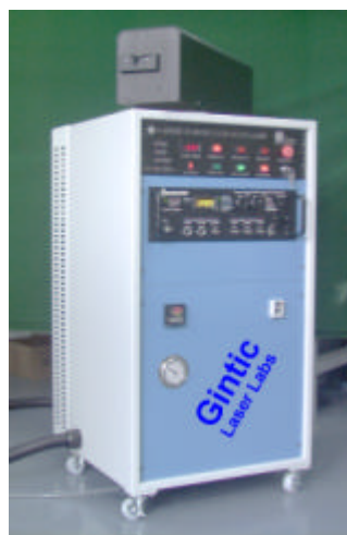
(b) 新加坡制造技术研究院研制的 二极管侧面泵浦固体激光器