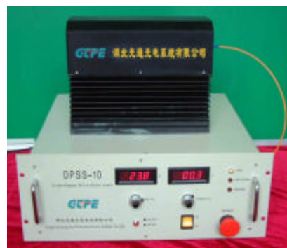
(b) 湖北光通生产的端面直接泵浦固体激光器