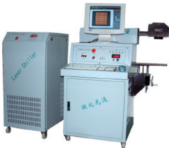
图四 湖北光通生产的二极管泵浦激光打标机

由于高功率全固化固体激光器的相继成熟，其应用领域也已从最成熟的光通讯方面向其它更为广阔的激光应用领域扩展，如材料加工中的激光标记、激光焊接、激光打孔和激光切割等，其它领域如激光医学、激光检测和测量等。图四给出了现在国内生产的最广泛使用的二极管泵浦固体激光打标机，而图五给出了国外生产的光纤激光打标机。