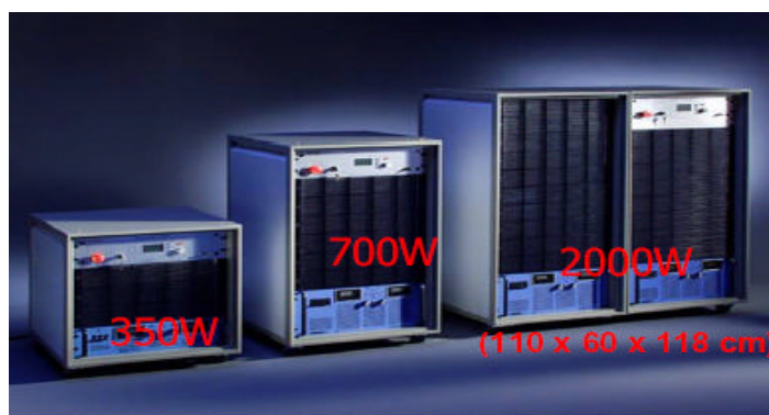
图三 IPG 生产的系列光纤激光器

光纤激光器基本结构和固体激光器的结构基本相同，由泵浦源（激光二极管和必要的光学耦合系统）、增益介质（掺稀土元素的增益光纤）、谐振腔（可为反射镜、光纤光栅或光纤环）等组成。按泵浦光的入射方式，光纤激光器可分为：端面泵浦光纤激光器、双包层光纤激光器和任意形状光纤激光器。