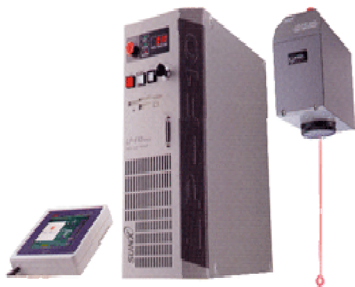
图五 日本生产的光纤激光打标机